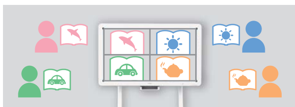
全員の意見をIWBに並べて表示。効果的かつ効率の良い授業を実現します

「ICT機器を組合せて使うことで、自校だけでなく他校生のノートの様子までリアルタイムに共有できれば、小規模校の面倒見の良さはそのままに、学びの幅はさらに広がります。また同年同士をつなぐことで、複式学級も解消できるでしょう。将来的には地域コミュニティ全体を活性化するツールとしても、期待しています(福校長)」。