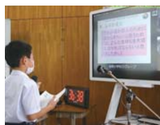
RICOH UCSで花徳小学校と母間小学校をつなぎ、IWBに表示した問題に、一緒に取り組みます。