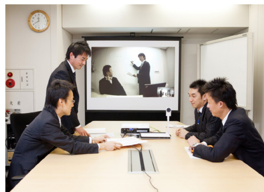
名古屋支店と接続中