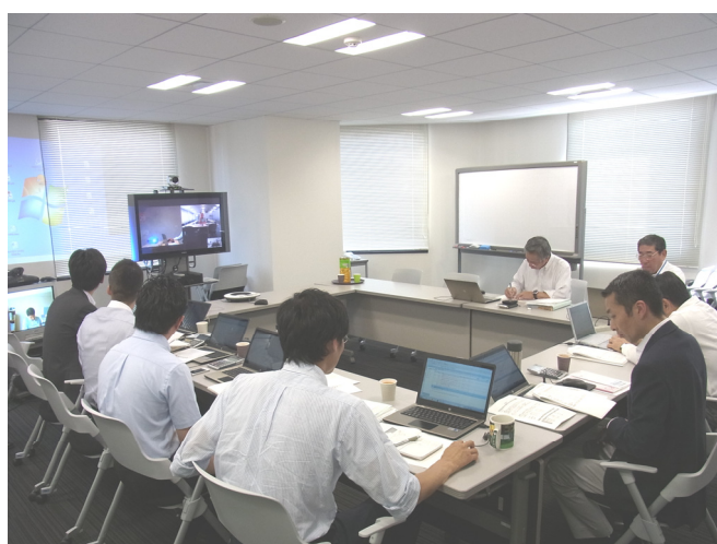
本社と海外拠点で定例会を実施中