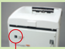
除湿ヒーターのスイッチ