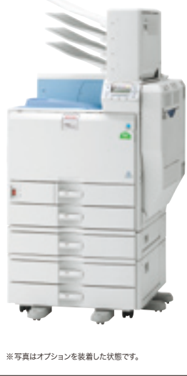
※写真はオプションを装着した状態です。