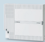
ビジネスフォン主装置

*1 本機能は、携帯電話網と固定電話回線を使用します。そのため、外出先/オフィスにかかわらず、携帯電話回線/固定電話回線のいずれか、または、両方に通話料金がかかります。そのため、モバイル端末と固定電話間の通話が定額料金になるサービスへの加入をお勧めします。詳細は販売店にお問い合わせください。*2 対応予定。