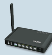
ネットワークルーター

プロバイダーサービスと無線LAN付きネットワークルーターをご提供。各種設定、保守・サポートはリコーにお任せください。また、プライベートクラウドサービス「RICOH e-Sharing Box」(別売)を組み合わせれば、ドキュメントをスマートデバイスから閲覧可能になり、時間と場所に縛られないワークスタイルが実現します。