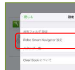
③“Ridoc Smart Navigator 設定”をタップ