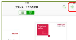
①Clear Book画面上部の設定ボタンをタップ

たった4つの手順でClear BookをRidoc Smart Navigatorに接続させることができます。