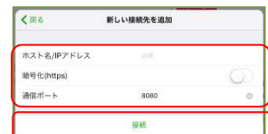
⑤Ridoc Smart Navigatorの接続情報を入力し、“接続”をタップ