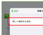
②“新しい接続先”をタップ