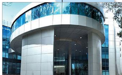
■ Ricoh Innovations Private Limited