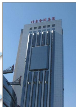
■ Ricoh Software Research Center (Beijing) Co., Ltd.