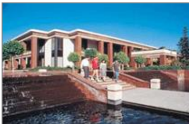
■ Ricoh Innovations Corporation