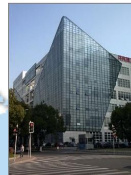
■ Ricoh Imaging Technology (Shanghai) Co., Ltd.