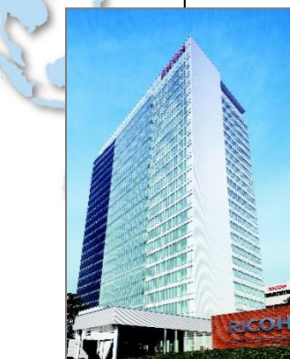
■ リコーテクノロジーセンター ■ リコーテクノロジー株式会社