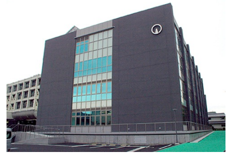
2017年4月3日にオープンした東館庁舎。4階の展望レストランとラウンジから富士山の絶景が望める。

新庁舎オープンを機に市の魅力発信ツールとしてデジタルサイネージをご導入。 エントランスに設置した4面マルチディスプレイで市民の皆様をお迎えし、 多彩な情報発信を実現。