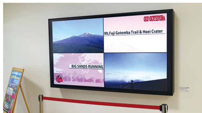
46インチ×4面のマルチスクリーン構成で80インチ相当の大画面を実現。 (写真は、4分割フォーマットでの画面表示)

マニュアルもわかりやすく、アプリケーションも使いやすかったので約1週間でオンエアの準備をすることができました。マルチディスプレイなので、全画面表示だけでなく、その特性を活かした4分割表示も出来ると面白いと考え、デザインを自作しました。最初に4分割のフォーマットを作っ