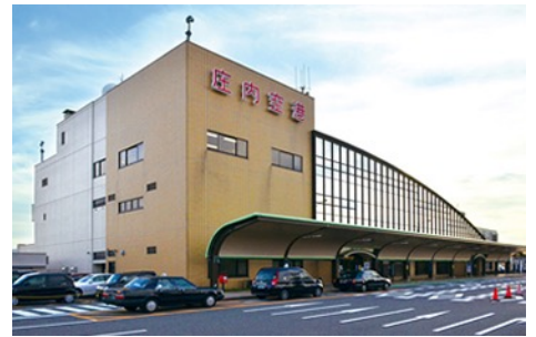
ユニークな外観は、庄内米のやわらかな曲線がモチーフになっている。