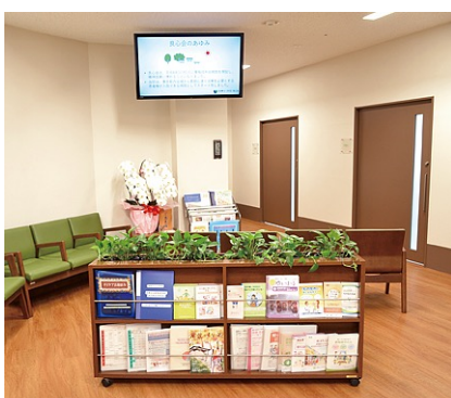
リビングのような落ち着いたある外来待合に、50インチのディスプレイを設置。