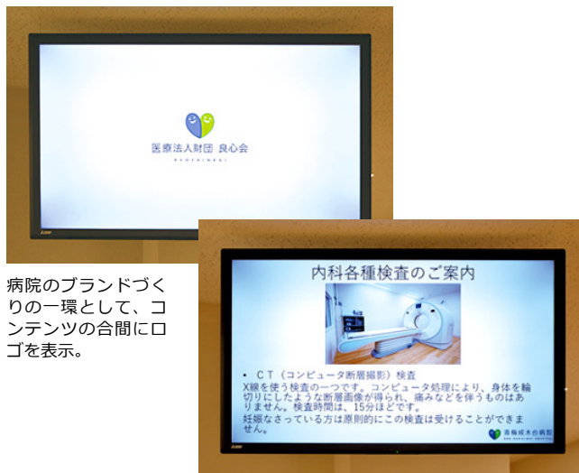
病院のブランドづくりの一環として、コンテンツの合間にロゴを表示。

パンフレットを設置し、自由に手に取っていただく従来の形では、興味のある方にしか、情報が届きにくかったのですが、デジタルサイネージの導入により、ロゴをはじめ、様々な情報を、自然に、かつ繰り返し目にしていただけるようになりました。また1台でたくさんの情報を配信できるので、外来待合の開放感は保ったまま、以前よりも多様なコンテンツをお届けできています。導入以来、職員からの評判は良く、来院される多くの皆様にいただいている印象があります。内容もデザインも自由にアレンジできるデジタルサイネージは、当院のブランドづくりに欠かせないツールとなっています。他の発行物との相乗効果で、病院の認知度を高め、青と緑のハートのロゴ＝青梅成木台病院、というイメージを、広げていけたらと思います。