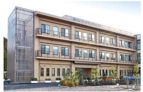
2017年5月に稼働を開始した総合診療棟。