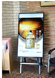
他媒体に掲載した広告をデジタルサイネージでも展開することで情報に触れる機会が増えます。