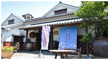
昨年の「新酒まつり」では、「明治蔵」にモニターを移設し、見どころ案内に活用しました。

リコーのデジタルサイネージはクラウド型で、インターネット環境があれば場所を問わず設置できる利点を活用して、「明治蔵」でのイベントに使用しました。芋焼酎の製造期間は8月～12月で、秋になると新酒が続々と登場します。そこで薩摩酒造では毎年10月末に「新酒まつり」を開催しています。昨年の「新酒まつり」では、デジタルサイネージを本社から「明治蔵」へ移動。スムーズな館内案内に活用しました。例年、館内の奥まった場所には人が流れにくかったのですが、入り口に設置したデジタルサイネージで見どころを分かりやすくご案内したところ、物販エリアまでスムーズに誘導することができました。当社では県内外で様々なイベントを行っていますので、「新酒まつり」でのデジタルサイネージ活用を経て、他のイベントでも有効に展開できる可能性を感じています。