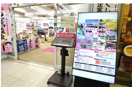
大型モニターで視線を集め、案内所内へ誘導する流れをつくっています。