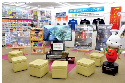
案内所中央のモニター。ゆっくり見ていただけるよう椅子を用意しています。