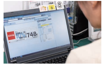
販売演出課では、部門ごとの担当者がPOP作成からデータのアップロードまでを行います。操作はいたってシンプル。

私どもが最初に目指したは無駄の削減です。店舗では印刷前に自部門の企画データを確認して、枚数設定・サイズ設定ができるようになったので、必要なサイズ・必要枚数をプリントして使用するようになりました。結果的には、廃棄ロスを20%まで削減し、仕分け作業もなくなりました。本部でも、POP印刷作業が大幅に削減されたため人的には約30%削減され、POP業務面ではあらゆる対応が非常にスムーズになりました。」(中嶋様)