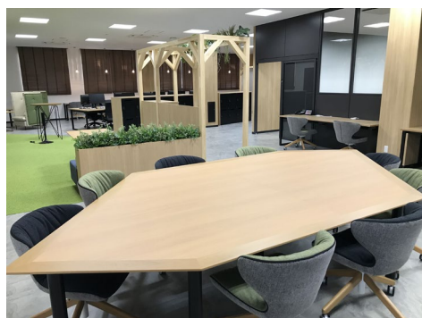
2階 執務エリア 様々なタイプのワークスペース

今後も、他拠点のリニューアルを進めるなど、より魅力的な企業として進化し続けることを目指しています。」