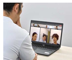
※画面はハメコミ画像です。

RICOH Meeting 360 V1を会議室の中央にセット。 リモート参加者も会議室の様子を360°の映像で体感できる。