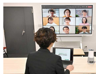
RICOH Interactive Whiteboardと セットで活用。 ※RICOH Interactive Whiteboardの 画面はハメコミ画像です。