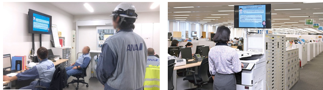
エンジニアリングサービス部の事務所 旅客サービス部などのオフィス

成田国際空港に広がる各部門の拠点と、受付に設置しています。 ・旅客サービス部、グランドサービス部、エンジニアリングサービス部 ・オペレーションサービス部、総務部などのオフィス・受付