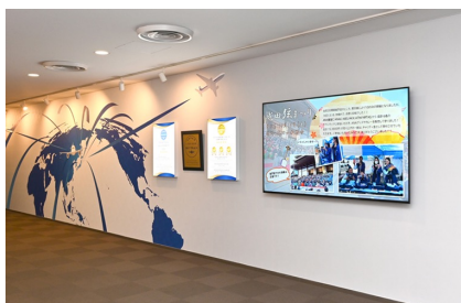
受付（ANA成田空港支店管理）