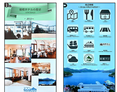
箱根ホテル創業100年の歴史。外国からのお客様にも視覚的に伝わるよう、写真をメインにレイアウト お問い合わせの多い情報について、Webページへのリンクをまとめたページ

四季折々の魅力をもっと配信していきたいですね。100年の歴史をもつ箱根ホテルだからこそ知っている見どころ、撮影スポットもありますので、こうした情報もコンテンツに盛り込んで、お客様の滞在がより豊かなものとなるようリコーデジタルサイネージをさらに活用していけたらと思っています。