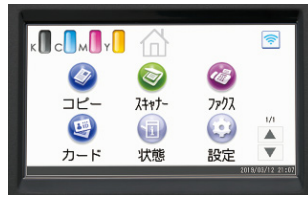
※写真はRICOH P C301SFです。

4.3インチのフルカラータッチパネルを搭載。多彩な情報をわかりやすく表示し、さまざまな設定も画面にタッチするだけで簡単に行なえます。