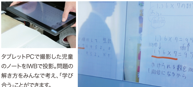
タブレットPCで撮影した児童のノートをIWBで投影。問題の解き方をみんなで考え、「学び合う」ことができます。

算数は答えはひとつでもさまざまな考え方があり、IWBを使えば子どもたちのノートを簡単に表示・比較して、「学び合い」の授業を実践することができます。また、理科の授業ではデジタル教科書を使って、IWBに星座を大きく映し出したり、動画で見せたり、星をつなぐ線を電子ペンで書かせるなど、興味・関心が持続する授業を行っています。6年生の外国語では動画と併せて音声機能を活かしたリスニングの授業、低学年の国語ではひらがなの書き順を学ぶ授業でも活用。すべての教科で一貫していることは、従来の「個の学び」ではなく、みんなで「学び合う」学習ができることです。