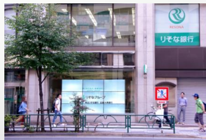
セブンデイズプラザ いけぶくろでのデジタルサイネージ

ターミナル駅近くという場所と、最適な配信コンテンツの組合せにより、デジタルサイネージはコストに見合った広告効果が得られていると感じています。