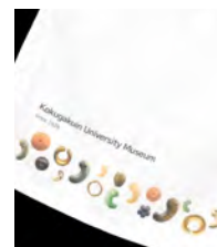
装身具をアレンジした ハンドタオル