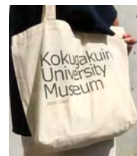
博物館の名前入り トートバック¥300