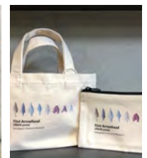
矢じりを印刷した ミニトート¥700、 ポーチ¥400