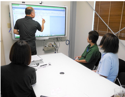
投影した資料に直接書き込んで頭の中のイメージまで正確に共有。

そのほか、イベントの構想やマニュアル作成、業務フローの見直しなど幅広く活用しています。IWB導入により、従来と比べて3～5倍も打ち合わせが充実するようになったと感じており、当社に欠かせないツールとなっています。」