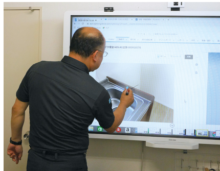
現場写真を大画面に表示し、細かな修繕点などを書き込みながら確認。