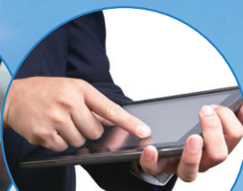
スマートデバイス セットアップ