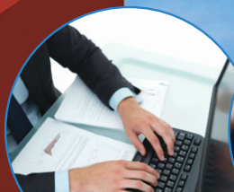
パソコン セットアップ