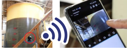
Wi-Fi™対応カメラでタンクの状況がスマートフォンで確認可能に 従業員の移動距離を大幅に削減